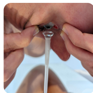
Pose de la lentille avec la ventouse SL

Nous vous conseillons d'utiliser la ventouse SL pour la pose de vos lentilles sclérales