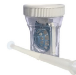
Ventouse SL et étui scléral