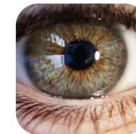
Pas de bulle, position de la lentille correcte