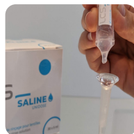
Remplissage de la lentille avec du sérum physiologique sans conservateur