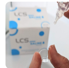
Rinçage de la lentille