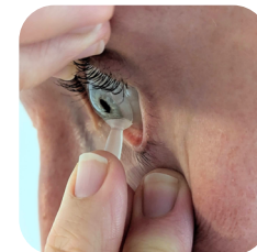
Retrait de la lentille avec une ventouse SL