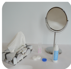
Etuis et produits prêts avant retrait