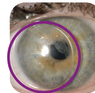
Bulle présente, refaire la manipulation