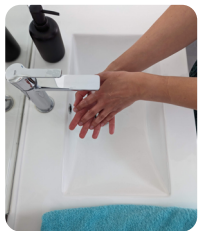
Hygiène des mains