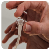
Pose de la lentille avec la ventouse SL sur un miroir à plat