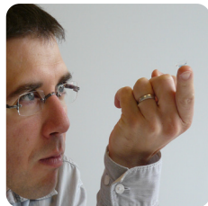
Vérification de l'intégrité de la lentille