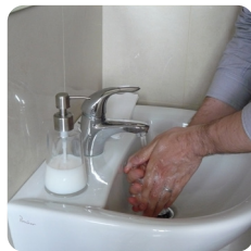
Hygiène des mains